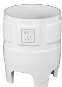
65.570.03 Drehmomentschlüssel für Ultraschallspitzen

► Mindestbestellung 3 Spitzen, gemischt möglich ◀