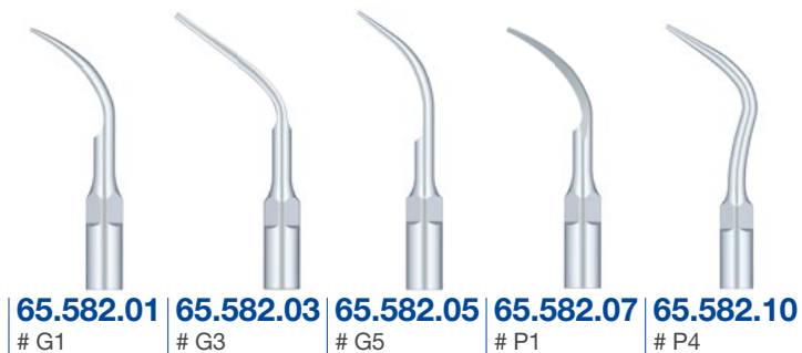
65.582.01 # G1 65.582.03 # G3 65.582.05 # G5 65.582.07 # P1 65.582.10 # P4