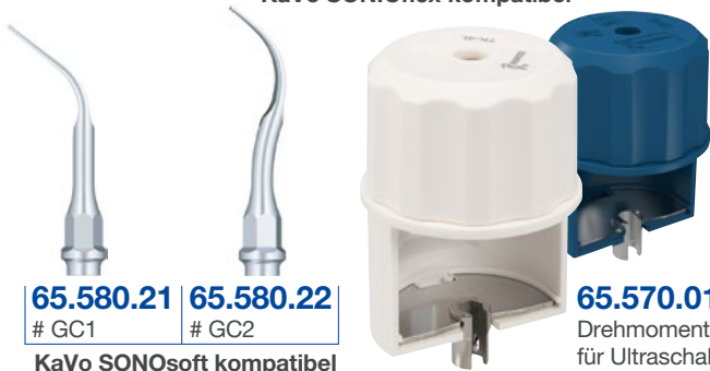
65.580.21 # GC1 65.580.22 # GC2