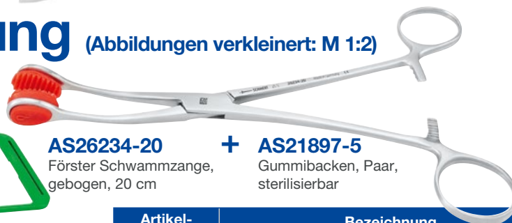
AS26234-20 Förster Schwammzange, gebogen, 20 cm

85.075.02 ■ PractiPal® Bohrerständer, gelb