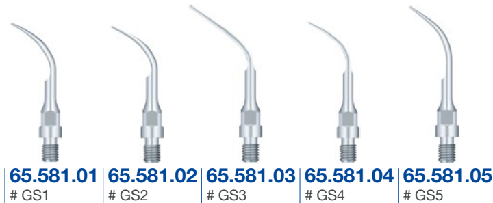
65.581.01 # GS1 65.581.02 # GS2 65.581.03 # GS3 65.581.04 # GS4 65.581.05 # GS5