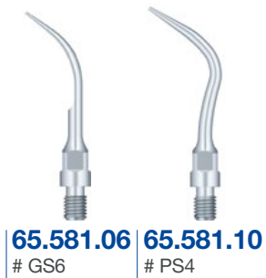
65.581.06 # GS6 65.581.10 # PS4