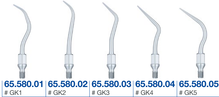
65.580.01 # GK1 65.580.02 # GK2 65.580.03 # GK3 65.580.04 # GK4 65.580.05 # GK5